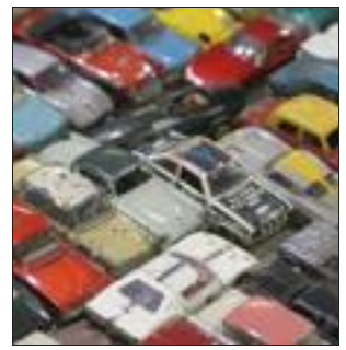
Cette bourse est une des plus importantes d'Europe.

■ Y ALLER Samedi 16 mars de 9 h 30 à 17 h, au Parc-Expo de Mulhouse, 120 rue Lefebvre. Entrée : 3 € (gratuit moins de 10 ans, 10 € à partir de 8 h avec les exposants).