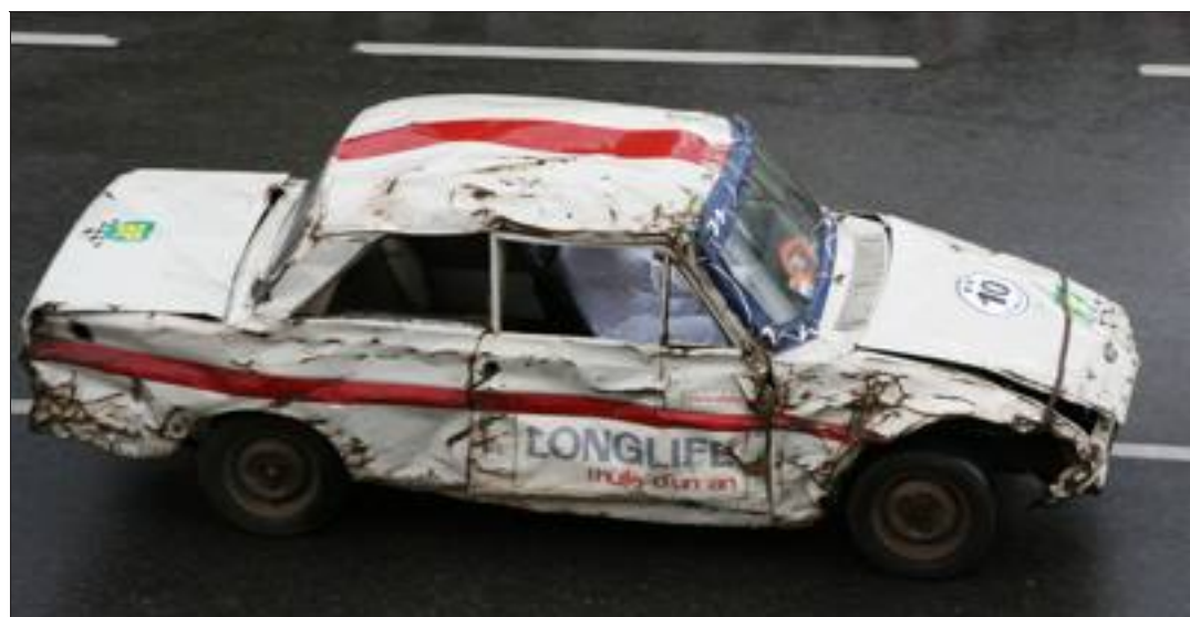
Cette incroyable Ford Taunus 12M a parcouru, en 1963, 358 273 kilomètres sur l'autodrome de Miramas, en 142 jours, malgré plusieurs tonneaux à cause de la somnolence d'un des sept pilotes qui se relaient au volant. Le record a été stoppé à cause de la fatigue des pilotes. La voiture rachetée par Frank Rousset en 2007 tourne toujours comme une horloge et est exposée dans de nombreux musées.